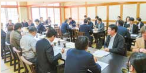
陽南幕田・雀宮・上三川支部 [令和8年2月19日(木)]