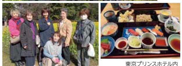
東京プリンスホテル内