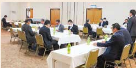
清住埴田・馬場宮園・中央支部 [令和8年3月2日(月)]