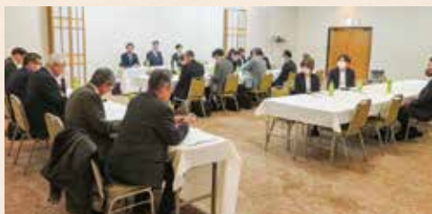
さくら・西原花房支部 [令和8年2月27日(金)]