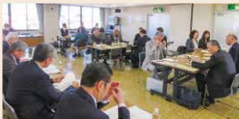
細谷戸祭・北・城山支部 [令和8年2月20日(金)]