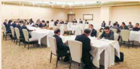
マロニエ・御幸平出・河内・上河内支部 [令和8年2月16日(月)]

組みとして、これまで18支部が個々に開催していた役員会を6ブロックに分け、初めて合同で開催しました。 合同で行うことによる課題を検証し、あらためて理事会で結果報告することとしています。