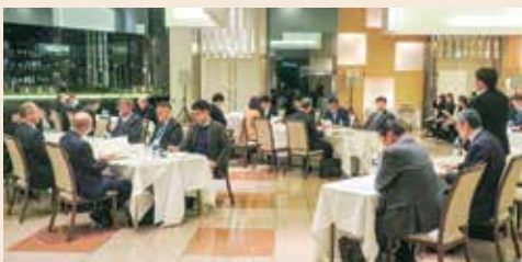
駅東・石井横田・清原支部 [令和8年2月26日(木)]