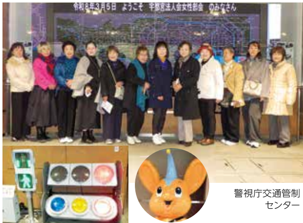
警視庁交通管制センター