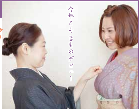
今年こそきものデビュー