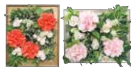
フラワーアレンジメント研修会