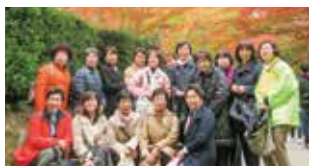
日帰り又は1泊視察研修会