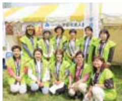
フェスタマイ宇都宮