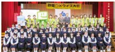
高校生税金〇×クイズ大会