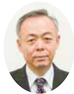
宇都宮税務署 署長 星 一 明