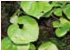
▼葵の御紋のモデル「フタバアオイ」

2020年の東京オリンピック・パラリンピック誘致が決定し国内はもとより海外のお客様がたくさん訪れる事が期待されています。私共女性部会は、それらの内外からのお客様に県内の観光地や銘産品を紹介する事も大切な「おもてなし」のひとつと考えています。今年