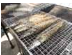
▲当日のさんま祭り風景