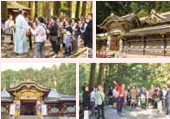
▲大猷院にて説明を受ける

400年式年大祭にあたり、早速10月2日(金)日光東照宮をお訪ねし、主な建造物や境内、宝物館などを案内していただきました。さらに日光山輪王寺大猷院も詳しく見せて戴き勉強になりました。当日は天候にも恵まれ昼食は、東照宮様のご好意により日光東照宮美術館の施設を使わせて戴き庭園を見ながら、秋を十分満喫致しました。ここに記して感謝申し上げます。次に船村徹記念館を見学し帰途に着きました。