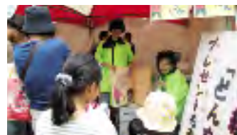
大型絵本の「もったいない婆さん」の読み聞かせを開催