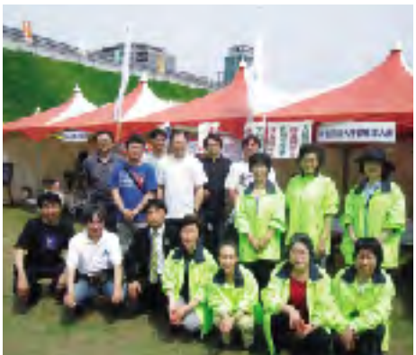
女性部会メンバーと仲良く

社会貢献活動と租税教育活動の一環として、女性部会さんと協同で5月22日(日)に開催された「フェスタmy宇都宮」にブース出店をいたしました。