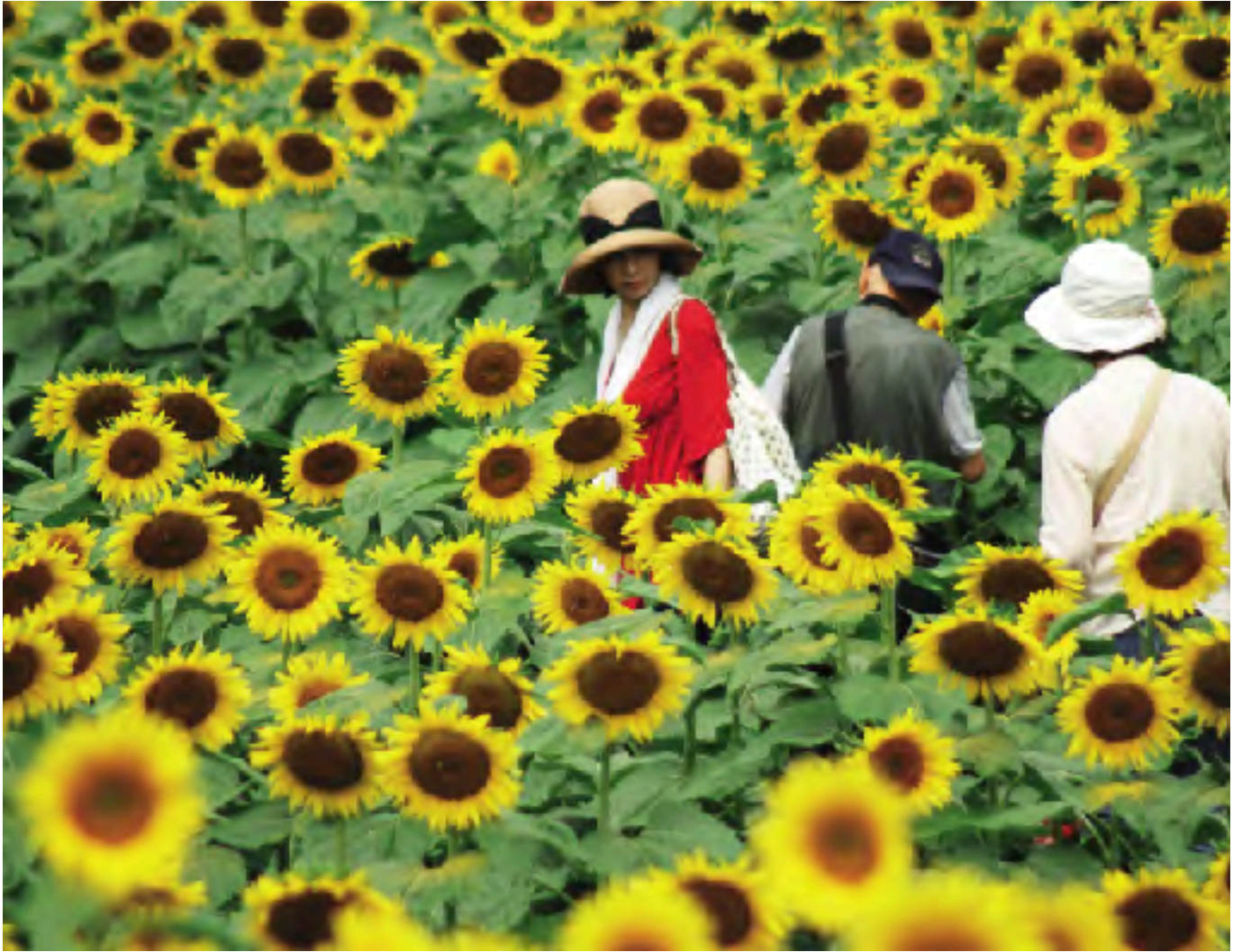
かみのかわサンフラワー祭り ( 8月 19日 ~ 24日 )