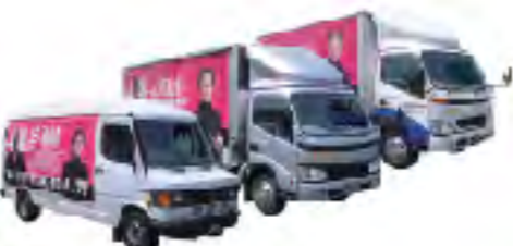
機密文書出張細断処理車