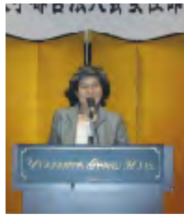
総会会場で挨拶する沓澤部会長